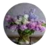
L' sociálna pracovníčka