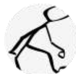
PP Terénny sociálny pracovník